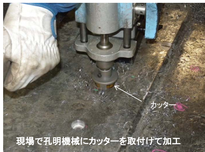
現場で孔明機械にカッターを取付けて加工