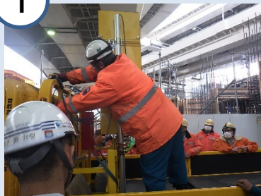
落下防止ワイヤーを外す