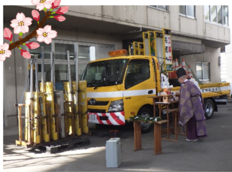
▲ 旧規制機材に御礼している様子

これまで使用してきた旧規制看板に、今までの感謝をこめて供養祭を行いました。当日は京急の生麦駅裏手にある杉山神社より宮司さんがお越しになり、多数の方に見守られながら執り行われ、無事に終了いたしました。