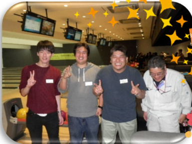
▲ チームで記念撮影★