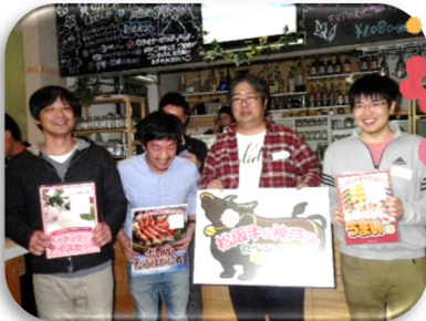
▲ チーム優勝の4名！ 本当におめでとうございます！