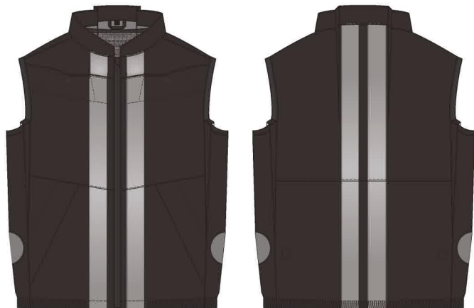
ファスナー閉じた状態